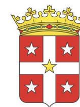
Città di Domodossola